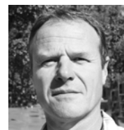
par Olivier HOCH Secrétaire général