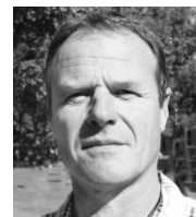
par Olivier HOCH Secrétaire général

Pour l'heure, et comme de coutume, il me reste, au nom du SNADEM, à vous souhaiter de bonnes vacances, en espérant que l'an prochain à la même époque vous ayez un peu plus d'argent à y consacrer.